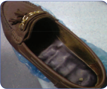
حجر صغير داخل الحذاء