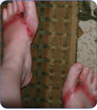
إلتهاب نتيجة إرتداء شبشب بسبور