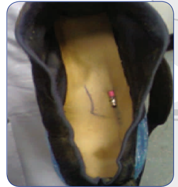
قلم داخل الحذاء