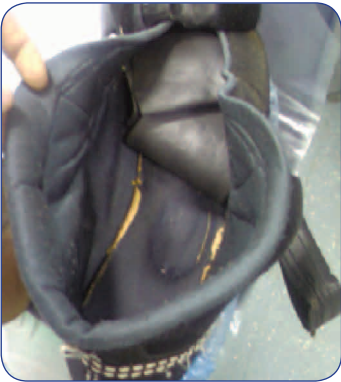
إنشاء بطانة الحذاء