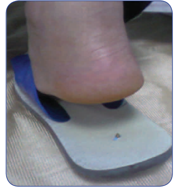
مسمار إخترق الشبشب