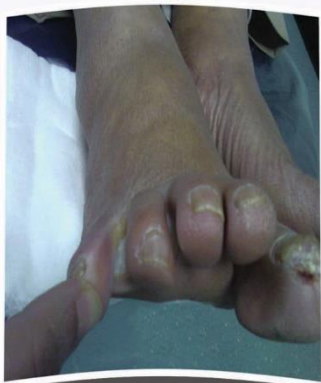
فطريات بين الأصابع