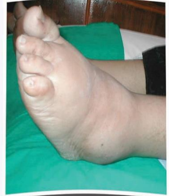
تورم بأحد القدمين