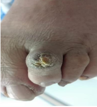
كالو ناتج عن الاصابع المخلبيه