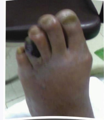
تغيير بلون القدم